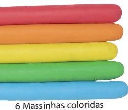
6 Massinhas coloridas