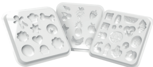
3 Moldes de alimentos (doces, salgados e frutas)