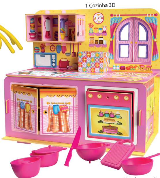
1 Cozinha 3D