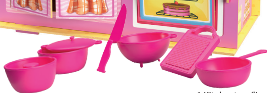
1 Kit de utensílios de plástico